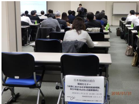
環境セミナーにおける専門家の講演（1）

カナダ政府の「複合木材製品からのホルムアルデヒド排出を削減する規則案」に対してコメントを提出した（H. 29. 9. 1 カナダ政府保健省）