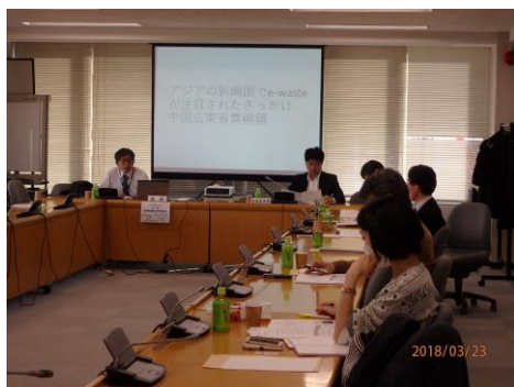
委員会でのアジア専門家との情報交換