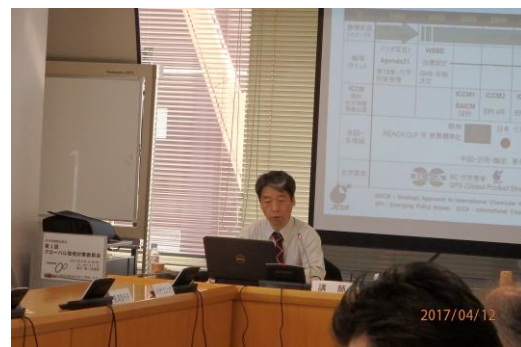
委員会での化学専門家との情報交換