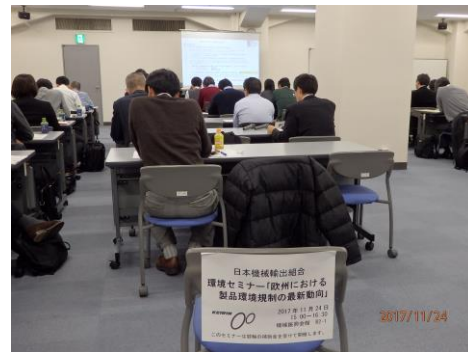
環境セミナー会場（2）